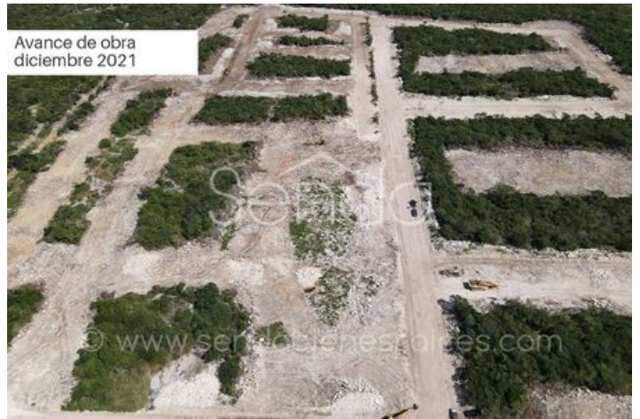
Avance de obra diciembre 2021