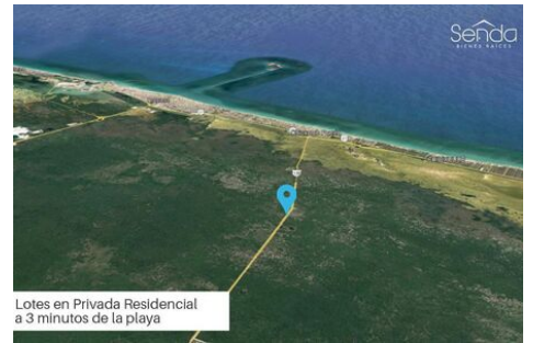
Lotes en Privada Residencial a 3 minutos de la playa