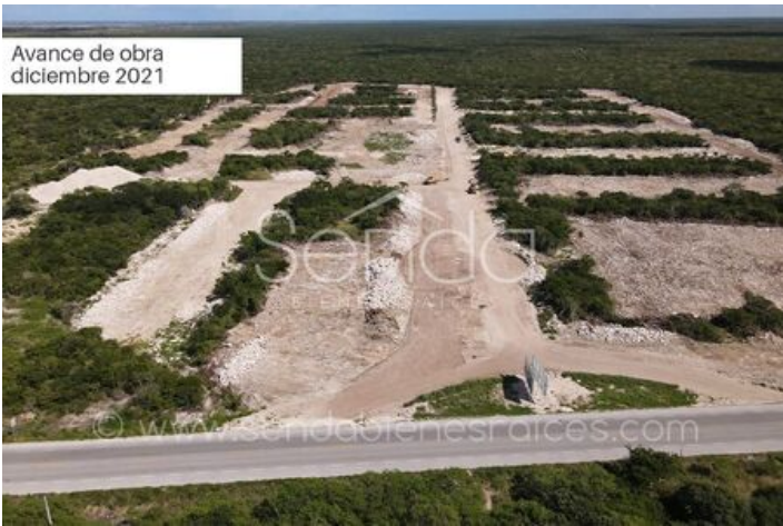
Avance de obra diciembre 2021