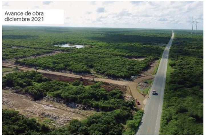
Avance de obra diciembre 2021